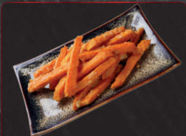
09. Süßkartoffelpommes 4,90 €