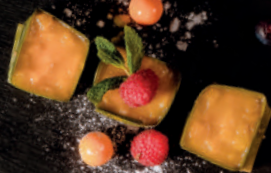
N5. Klebreis Mango 5,20 €