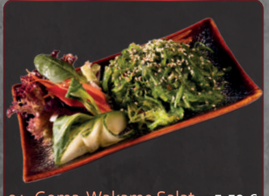
04. Goma-Wakame Salat 5,50 € Seetangsalat mit Sesamsoße