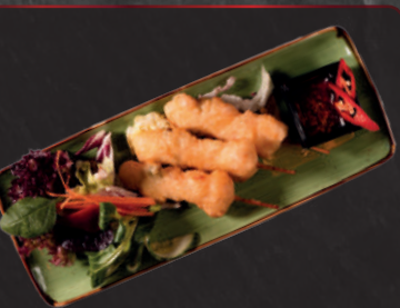
10. Tempuraspieße 1, a 5,90 € Garnelen-Gemüsespieße in Teigmantel