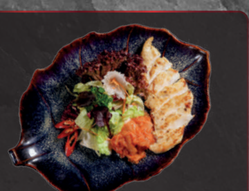
18. Grilled Chicken m. Kimchi 8,50 € Gegrillter Hühnerbrust mit fermentiertem Chinakohl (l. scharf)