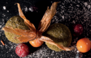
N3. Matcha-Mochi 1,2 3,90 € Japanischer Reiskuchen mit Grünteegeschmack und einer cremigen Grünteefüllung