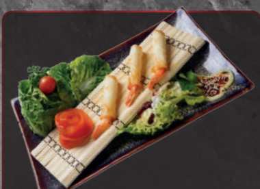
17. Prawns Roll Style n, 2 5,90 € Frittierte Garnelen mit Schwanz- segment in Frühlingsrollenteig