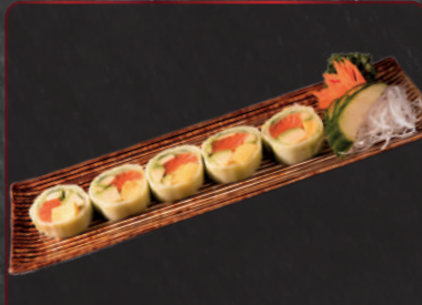
05. Kyuri 7,50 € Lachs, Eierstich in Gurke