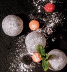
N9. Mochi 1, a

Frittierte Reismehlbällchen mit Mungobohnenfüllung, umhüllt von weißem Sesam.