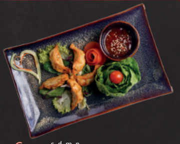
02. Gyoza c, d, m, n 5,50 € Gegrillte Teig- taschen mit Hühner- und Gemüsefüllung