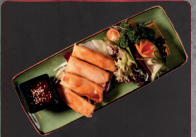
08. Mini Springrolls 1, a 3,50 € Gefüllt mit verschiedenem Gemüse (4 Stück)