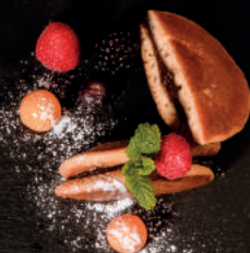
N6. Dorayaki 1,2 4,90 € Japanische Waffeln mit einer Füllung aus süßen roten Bohnen