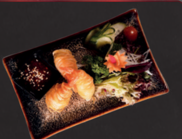
07. Garnelen im Kartoffelnest 1, a 4,90 €