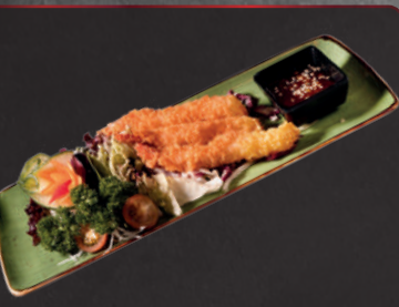
11. Ebi Tempura 1, a 4,50 € Frittierte Riesengarnelen mit Chilisoße