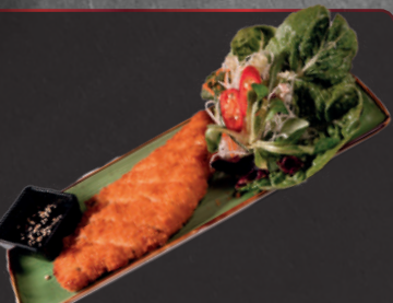
15. Chikin Yaki 1, a, 4, f 5,90 € Knusprig gebackene Hähnchen mit Unagisoße