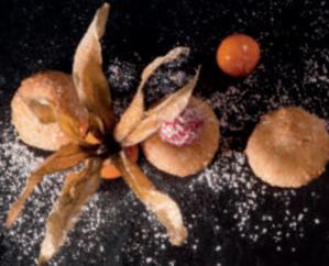
N1. Kokosnussbällchen (3 Stk.) 5,90 € Japanischer Reiskuchen mit Mungobohnenfüllung, umhüllt von Kokosnussflocken