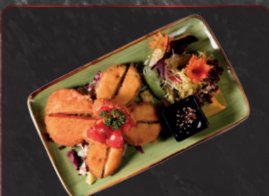
13. Yasai Tempura 1, a, 4, f 5,90 € Frittiertes, frisches Gemüse in Teigmantel