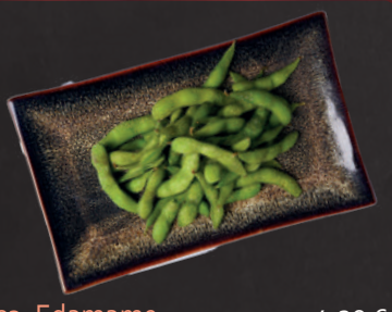
03. Edamame 4,20 € Grüne junge Soja- bohnen im gekochtem Salzwasser