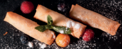
N2. Bananen-Frühlingsrollen (3 Stk.) 5,90 € Knusprige Reismehllullen mit Bananenfüllung