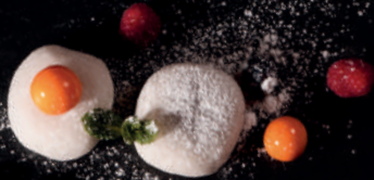
N7. Klebreis Kokos