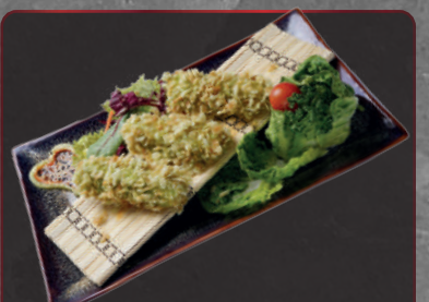
16. Crispy Prawns n, 2 6,90 € Frittierte Riesengarnelen in Grünreis-Flocken