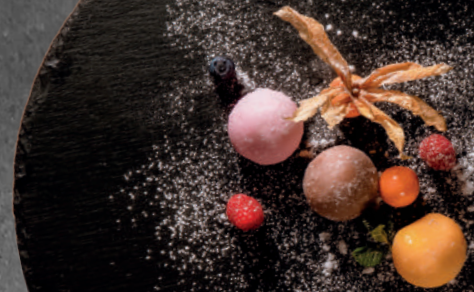
N10. Mochi-Eis (3 Stk.)