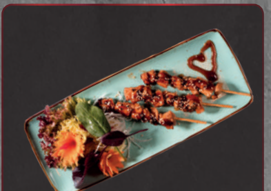
12. Yakitori Spieße 1, a, 4, f 5,50 € 3 typisch japanisch gewürzte Hähnchenspieße