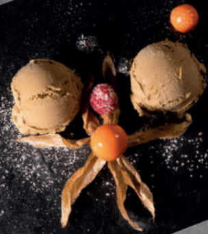
N4. Matcha-Eis 1,4 3,90 € Eis mit japanischem Grünteegeschmack