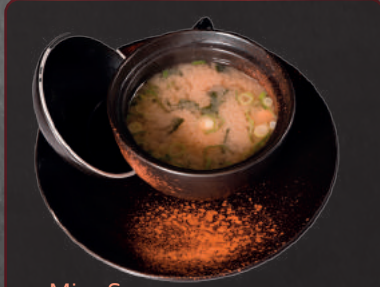
01. Miso Suppe 3,90 € Sojamarke- suppe mit japanischem Tofu, jungem Lauch und Seetang