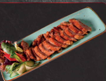
14. Kamo Yaki 1, a, 4, f 6,50 € Knusprig gebackene Ente mit Unagisoße