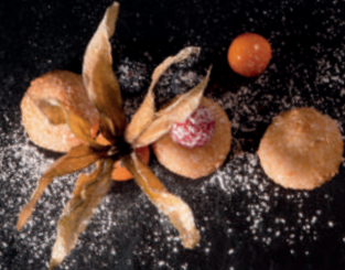
N8. Banh Cam 1, a